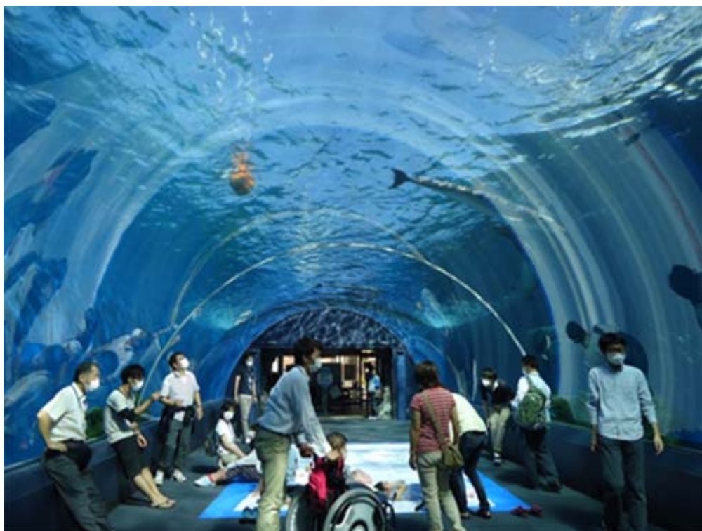
光あふれるアクアチューブで一休み