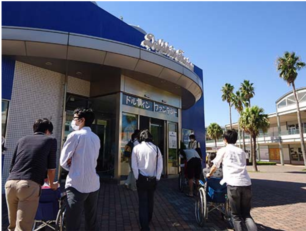
ドルフィンファンタジー（イルカショー）も満喫しました！