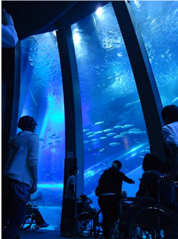
まるで海の中にいるみたい