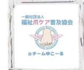
爪のレスキュー隊 (チームゆこーる)