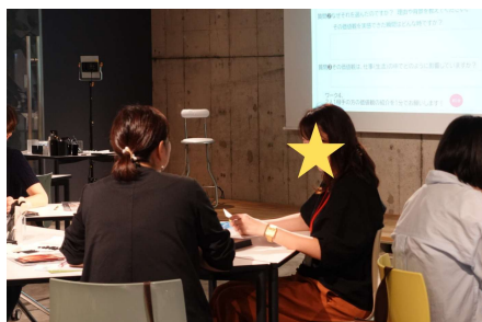
価値観発見ワークショップ