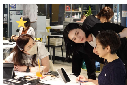
好印象メイク・スキンケアレッスン