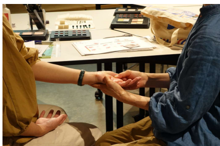
ハンドトリートメント体験