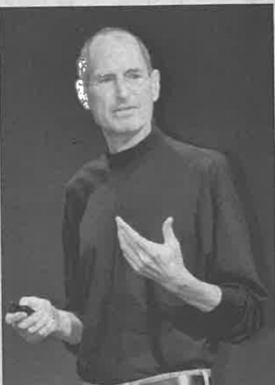
神経内分泌腫瘍で亡くなったスティーブ・ジョブズ氏。2011年3月、米サンフランシスコ

NETはその名の通り、ホルモンを分泌する神経内分泌細胞に由来する腫瘍。型によって血糖値を調節するインスリンやグルカゴン、胃酸分泌に関わるガストリンなどのホ