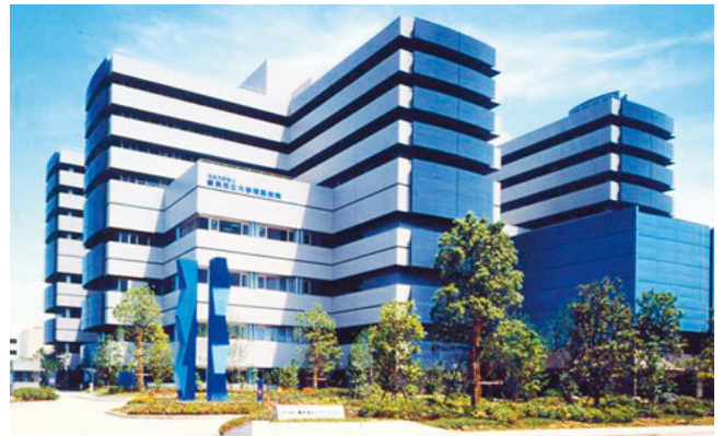
横浜市立大学附属病院

将来のすばらしい専門医を育てるべく多くの優秀かつ熱心な指導医を揃えて皆さんをお待ちしています。