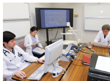
各教室で活発に行われる症例検討会