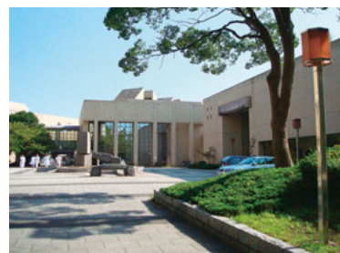
医学情報センター 土日夜間も利用可能