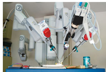
平成26年度に導入した手術支援ロボットダヴィンチ 卒前教育から専門医教育まで幅広いニーズに応える充実した設備

本プログラムは単に専門医を養成するだけでなく、医療安全を重視し、患者本位の医療サービスが提供できる医師、医学の進歩に貢献し、日本の医療を担える医師を育成することを目的としています。