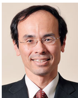
横浜市立大学 附属市民総合医療センター 病院長