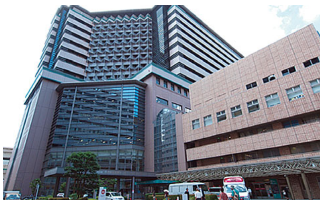
横浜市立大学附属市民総合医療センター

出身大学による壁が全くなく、先輩が後輩を丁寧に教えるのが、国際港湾都市・横浜に立地する本学の伝統です。さらに、専攻医プログラム中に、結婚・出産・子育てなどが重なっても大丈夫なよう、家庭生活と両立できる研修体制の確立にも取り込んでいます。