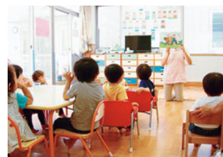
女性医師のキャリアを支援する保育室 病児・病後児の保育にも対応しています