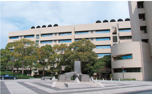
横浜市立大学医学部

本学は、“横浜という街の魅力”と共に“いわゆる学閥がなく、出身大学に拘らず暖かく全ての専攻医の皆様を迎える伝統的な学風”を有する魅力ある専門医育成機関であると自負しております。関連病院を基幹とするプログラムも含めて、ご相談いただければ、皆様のニーズに応えられるプログラムをご提案できると考えております。多くの皆様が本学で研鑽を積まれることを願っております。