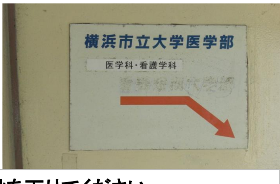
病院には入らずに右の階段を下りてください。