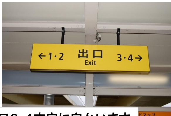
市大医学部駅を出て、出口3・4方向に向かいます。