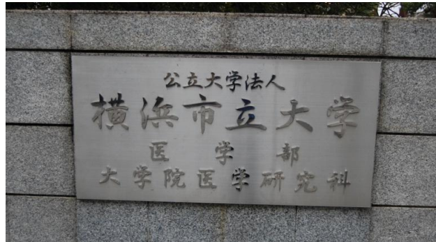
横浜市立大学 医学部の門がみえてきますので、中にお入り