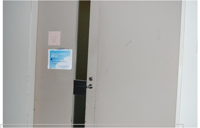
シミュレーションセンター入口