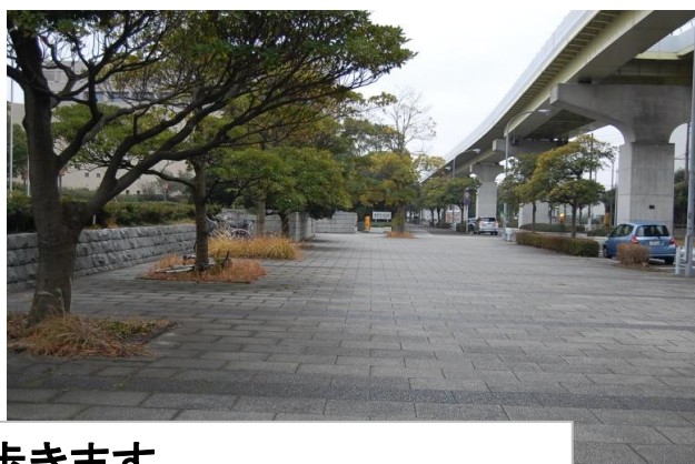
出口4から降り、まっすぐ歩きます。