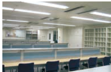
センター病院研修医室

新しい臨床研修制度が導入されてから、附属2病院ではプログラムの向上に努めてきました。まず、神奈川県近傍の中核病院と連携して豊富な指導医のもとで指導を受けることができましたようにしました。平成23年度には救急研修のプログラムを大幅に改善しました。また、2年目は県内の診療所や北海道、福島、三重、和歌山、高知、長崎、鹿児島等の病院で中身の濃い地域医療研修を受けることができるように工夫をしています。さらに、皆さんの学びや憩いの場となる研修施設の充実も行われ研修環境も良好となっています。ぜひ、横浜市立大学病院群で初期研修を受け、キャリアの基礎を築いてください。