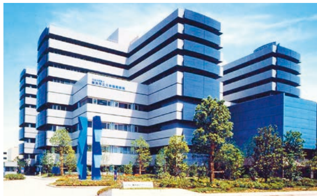
横浜市立大学附属病院

初期研修を修了された先生方が、これからの医師として一生を捧げるであろう専門分野を選び、腕を磨き、教育を受け、専門医として成長していく場の一環としてこの専門医養成プログラムがあります。ほとんどの先生方は、同時に豊富なスタッフで構成される大学医学部の20を越す専門診療分野の教室（いわゆる医局）に所属し、その専門診療科や専門別センターのシニア・レジデントとなります。新専門医制度については、現在市内・県内の主要教育指導病院と専門医養成プログラムの連携体制をとって専門医修習課程が企画されています（横浜市大・神奈川専門医養成プログラム）。さらに、大学院で研究を同時に行うことが出来るシステムも選択可能です。これら多くの選択肢の中から自分に適した分野を選び、我々と一緒に日本の医療を担う第一歩をここ横浜市立大学で踏み出しましょう。心より歓迎いたします。