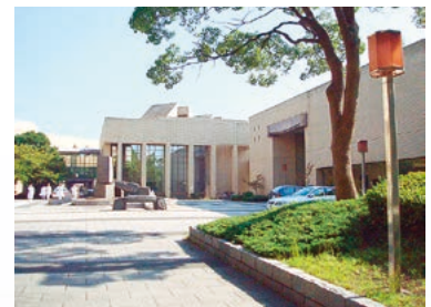
医学情報センター 土日夜間も利用可能