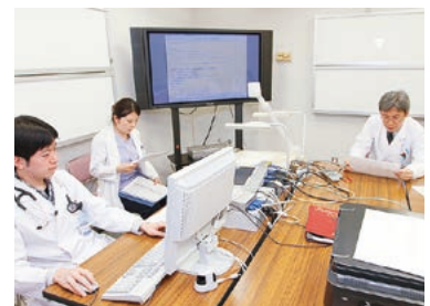
各教室で活発に行われる症例検討会