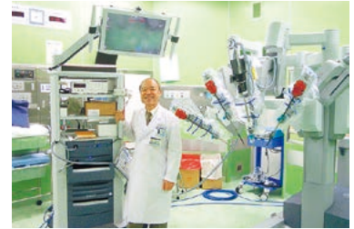
平成26年度に導入した手術支援ロボットダヴィンチ 卒前教育から専門医教育まで幅広いニーズに応える充実した設備

本プログラムは単に専門医を養成するだけでなく、医療安全を重視し、患者本位の医療サービスが提供できる医師、医学の進歩に貢献し、日本の医療を担える医師を育成することを目的とするものです。