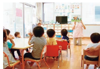
女性医師のキャリアを支援する保育室 病後児の保育にも対応しています