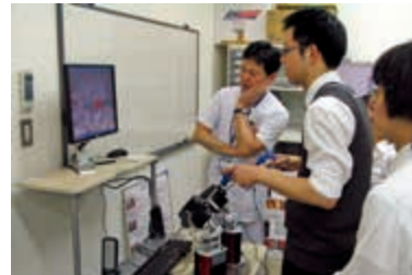
シミュレーションセンターにある腹腔鏡シミュレーター 卒前教育から専門医教育まで幅広いニーズに応える充実した設備

本プログラムは単に専門医を養成するだけでなく、医療安全を重視し、患者本位の医療サービスが提供できる医師、医学の進歩に貢献し、日本の医療を担える医師を育成することを目的とするものです。