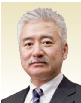
横浜市立大学 附属市民総合医療センター 病院長