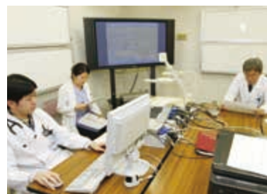
各教室で活発に行われる症例検討会