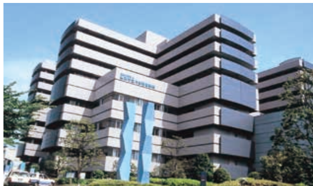
横浜市立大学附属病院

初期研修を修了された先生方が、これからの医師として一生を捧げるであろう専門分野を選び、腕を磨き、教育を受け、専門医として成長していく場の一環としてこの専門医養成プログラムがあります。ほとんどの先生方は、同時に豊富なスタッフで構成される大学医学部の20を超える専門診療分野の教室（いわゆる医局）に所属し、その専門診療科や専門別センターのシニア・レジデントとなります。また、市内はもちろん県内外の主要基幹病院（10ヶ所以上の病床数500床を超す教育病院も含む）を中心とした教育指導協力病院でのローテーションも含め研修を積むことも可能です。さらに、大学院、内地、外地での留学等で研鑽等を積むことが出来るシステムも選択可能です。これら多くの選択肢の中から自分に適した分野を選び、我々と一緒に日本の医療を担う第一歩をここ横浜市立大学で踏み出しましょう。心より歓迎いたします。