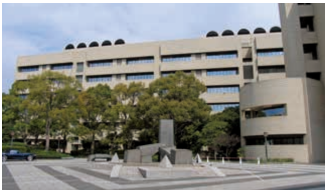
横浜市立大学医学部

ところで、医療の質を高める努力は次世代に対する私たちの責任です。医療の質は医学研究に裏打ちされたものでなくてはなりません。高次専門医療研修においても総合医療研修においても、生じる疑問を研究の形で解決する努力も大学医学部の役割です。個別の小さな疑問でも普遍的なものであれば、世界を動かす研究成果を生むことを実証しています。高次医療と総合医療、これに研究活動が加わることでみなさんの研修はさらに充実したものになるはず。これから始まる専門医研修を、さらに質の高いものにしていきましょう。みなさんを心より歓迎致します。