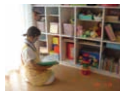
女性医師のキャリアを支援する保育室 病児の保育にも対応しています