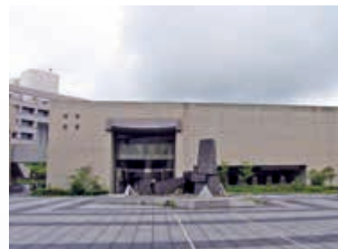
医学情報センター 土日夜間も利用可能