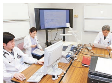
各教室で活発に行われる症例検討会