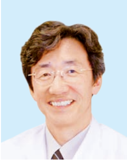
横浜市立大学 附属市民総合医療センター 病院長