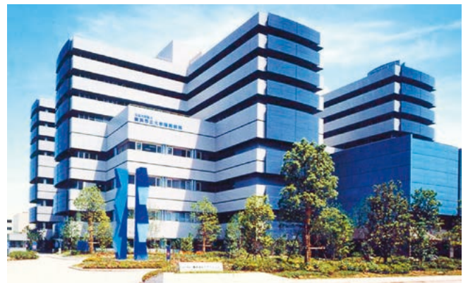
横浜市立大学附属病院

初期研修を修了された先生方が、これからの医師として一生を捧げるであろう専門分野を選び、腕を磨き、教育を受け、専門医として成長していく場の一環としてこの専門医養成プログラムがあります。ほとんどの先生方は、同時に豊富なスタッフで構成される大学医学部の20を越す専門診療分野の教室（いわゆる医局）に所属し、その専門診療科や専門別センターのシニア・レジデントとなります。また、市内はもちろん県内外の主要基幹病院（10ヶ所以上の病床数500床を越す教育病院も含む）を中心とした教育指導協力病院でのローテーションも含め研修を積むことも可能です。さらに、大学院、内地、外地での留学等で研鑽等を積むことが出来るシステムも選択可能です。これら多くの選択肢の中から自分に適した分野を選び、我々と一緒に日本の医療を担う第一歩をここ横浜市立大学で踏み出しましょう。心より歓迎いたします。