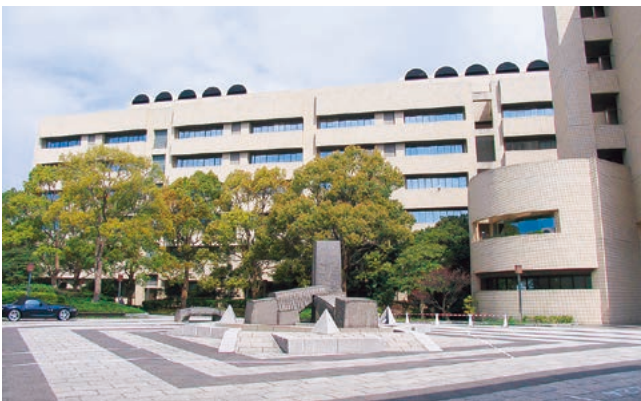
横浜市立大学医学部

ところで、医療の質を高める努力は次世代に対する私たちの責任です。医療の質は医学研究に裏打ちされたものでなくてはなりません。高次専門医療研修においても総合医療研修においても、生じる疑問を研究の形で解決する努力も大学医学部の役割です。個別の小さな疑問でも普遍的なものであれば、世界を動かす研究成果を生むことを実証しています。高次医療と総合医療、これに研究活動が加わることでみなさんの研修はさらに充実したものになるはずです。これから始まる専門医研修を、さらに質の高いものにしていきましょう。みなさんを心より歓迎いたします。