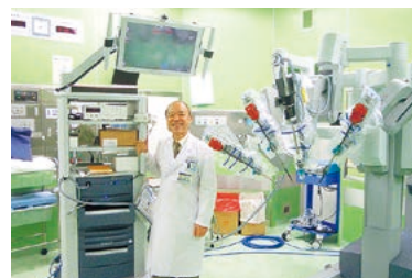
平成26年度に導入した手術支援ロボットダヴィンチ 卒前教育から専門医教育まで幅広いニーズに応える充実した設備

本プログラムは単に専門医を養成するだけでなく、医療安全を重視し、患者本位の医療サービスが提供できる医師、医学の進歩に貢献し、日本の医療を担える医師を育成することを目的とするものです。