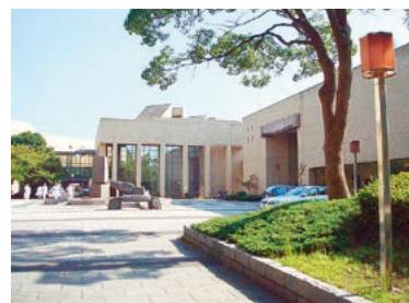
医学情報センター 土日夜間も利用可能