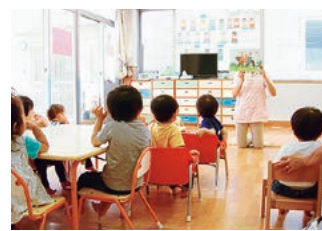
女性医師のキャリアを支援する保育室病後児の保育にも対応しています